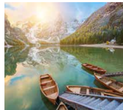
> Pragser Wildsee | Lago di Braies

There is a convenient bus stop at Camping Antholz from which you can travel to your summer destination at no cost. What more could one ask for?