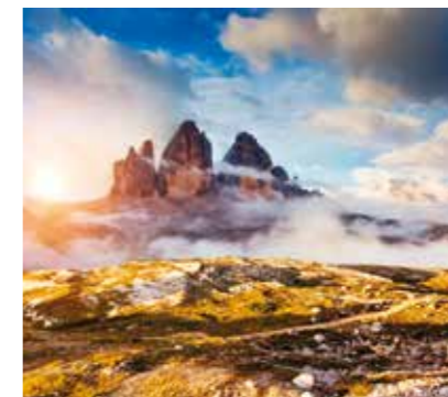
> Drei Zinnen | Tre Cime