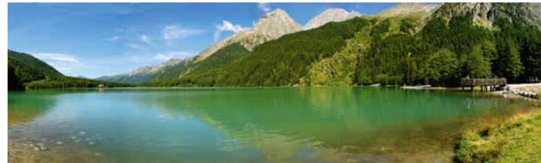
> Antholzer See | Lago di Anterselva