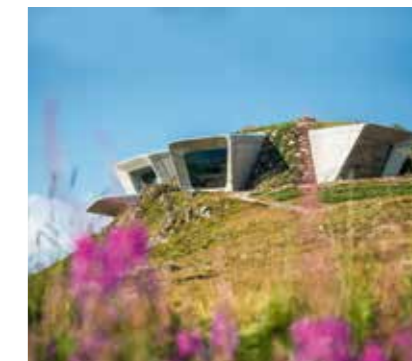
> MMM Corones – Kronplatz | MMM Corones – Plan de Corones