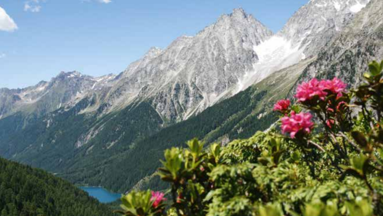
> Staller Sattel | Passo Stalle